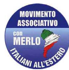
Mov. Ass. Italiani ALL'ESTERO