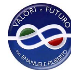
VALORI E FUTURO