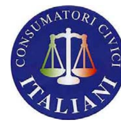
CONSUMATORI CIVICI ITALIANI