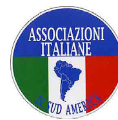
ASS. ITAL. SUD AMERICA